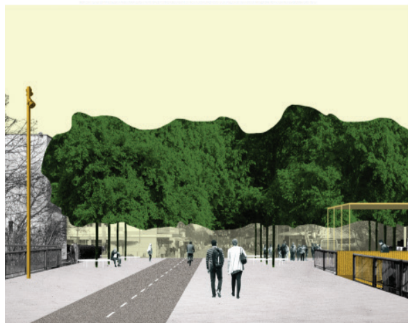
Súťažný návrh PLURAL