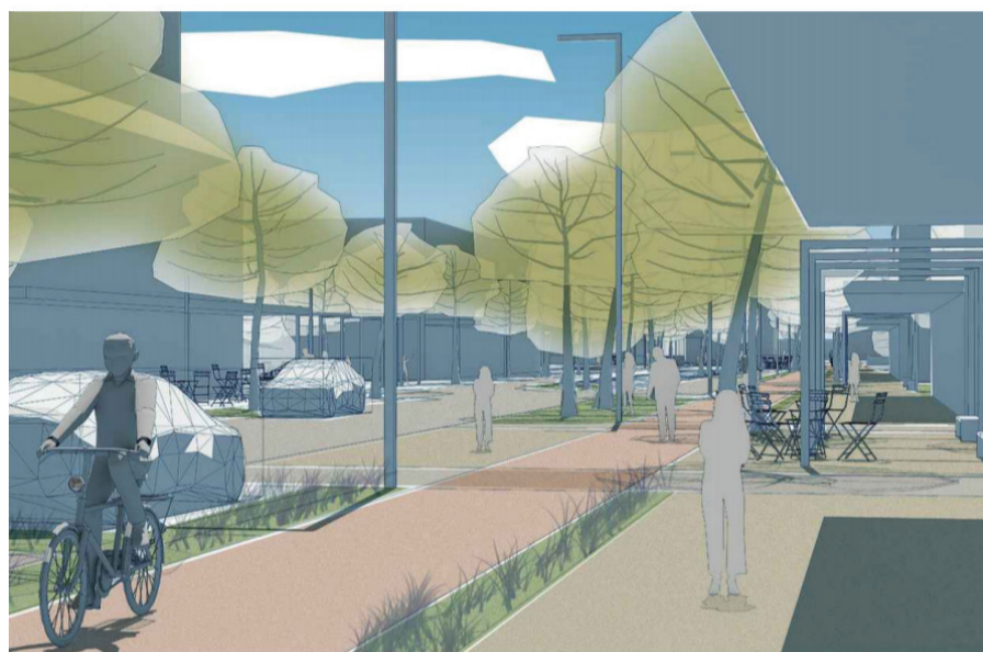
Súťažný návrh PLEIDEL