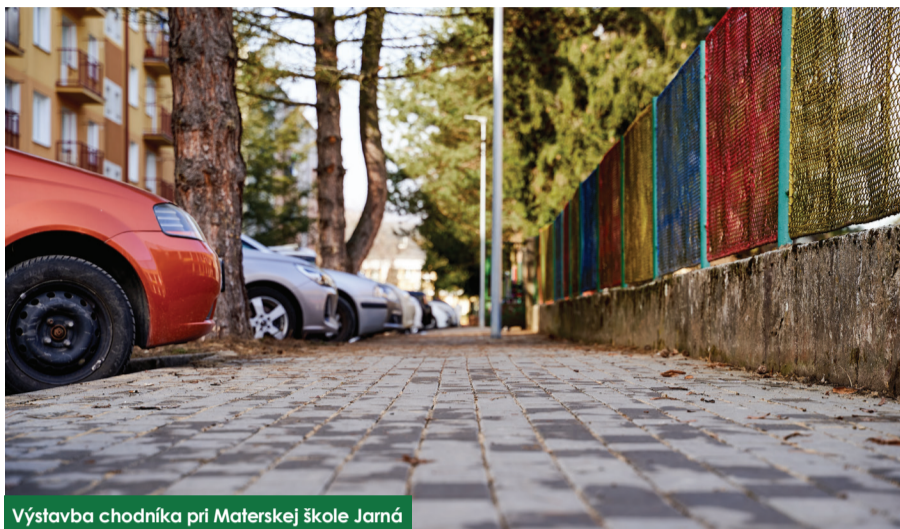
Výstavba chodníka pri Materskej škole Jarňá