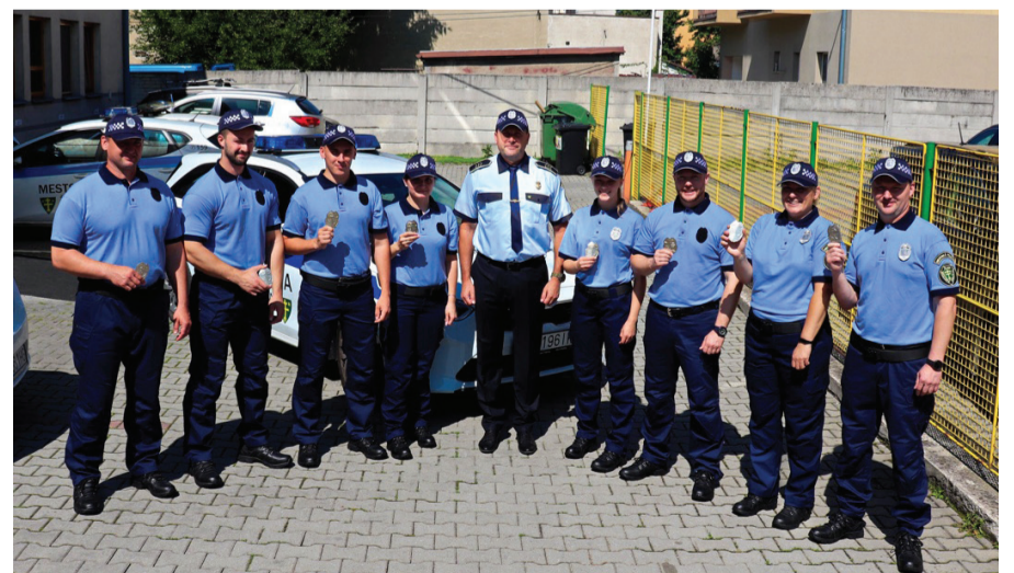
Mestská policajti pôsobia v 6 okrskoch na území mesta Žilina.

mestská polícia aj ďalšie úlohy vyplývajúce z jej činnosti. Dohliada na bezpečný a bezproblémový priebeh podujatí, vykonáva preventívno-bezpečnostné a edukačné aktivity zamerané na prevenciu, zabezpečuje odchyt túlavých zvierat či monitoruje verejné priestranstvá kamerovým systémom. Dôležitou súčasťou aktivít mestskej polície je aj spolupráca s Policajným zborom SR, záchrannými zložkami i orgánmi verejnej a štátnej správy.