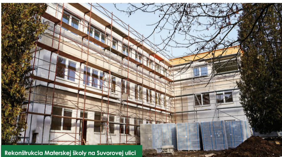
Rekonštrukcia Materskej školy na Suvorovej ulici

V súčasnosti približne 40-ročná budova materskej školy, ktorá sa skladá z 5 pavilónov, prejde celkovou rekonštrukciou, čím sa navýši kapacita zo súčasných cca 160 na cca 200 detí. Pri spracovaní dokumentácie sa vychádzalo z požiadaviek investora na zvýšenie kapacity materskej školy, ako aj zníženie energetickej náročnosti riešených pavilónov. Všetky pavilóny budú kompletne zateplené vrátane výmeny okien a dverí, z toho pavilóny č. 1 a 2 budú nadstavené o jedno podlažie a bude vymenená kompletná elektroinštalácia vrátane nových svietidiel. Vonkajší areál bude doplnený o nové hracie prvky. Taktiež budú zrekonštruované sociálne zariadenia vrátane výmeny vykurovacích telies a vybudované nové oplotenie. Farebnosť novej fasády s umeleckým spretrením sa v súčasnosti konzultuje s Útvárom hlavného architekta. Náklady na rekonštrukciu budú predstavovať sumu cca 1 300 000 eur. Aktuálne práce napredujú podľa harmonogramu, predpokladaný termín otvorenia materskej školy je september 2021.