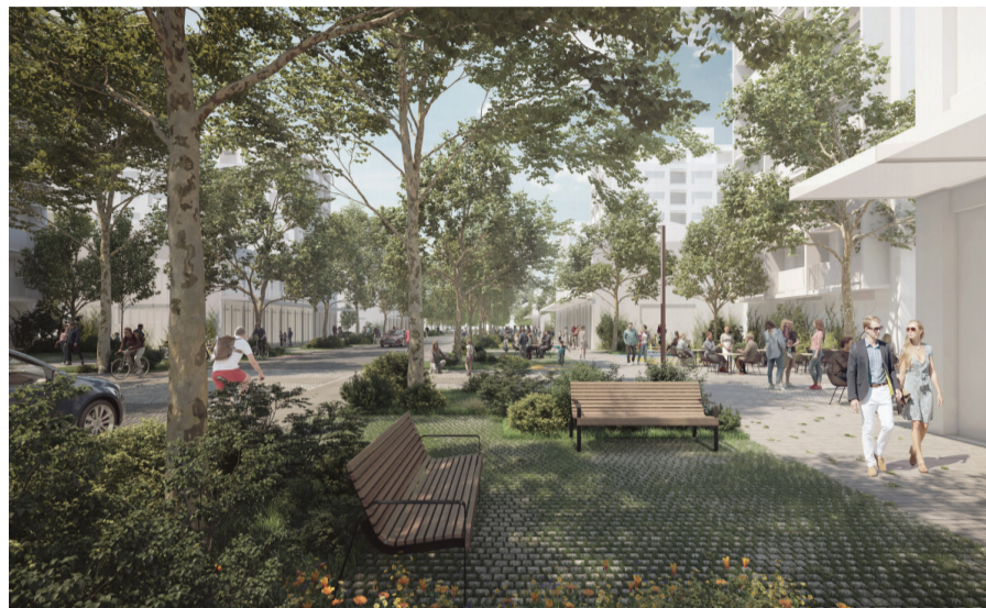
Súťažný návrh SLLA

Výhodou víťazného návrhu je jeho robustnosť, čo umožňuje jednoduché vstrebanie zmien a úprav, ktorými