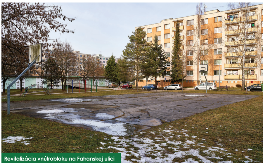
Revitalizácia vnútrobloku na Fatranskej ulici