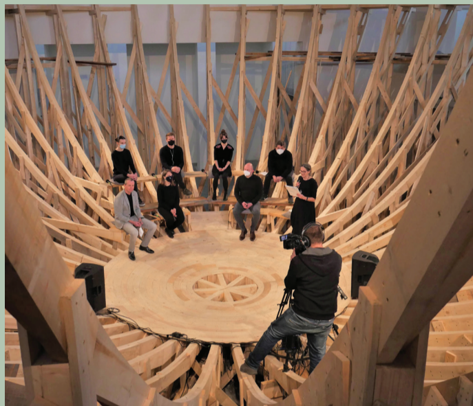
Pracovník tím EHMK 2026 počas online prezentácie

Vyvrcholenie príprav Žiliny do prestížnej súťaže európskeho formátu pripadlo na 4. február. O postupujúcich mala rozhodnúť 30-minútová online prezentácia a následná 60-minútová sekcia otázok a odpovedí pred 11-člennou medzinárodnou porotou. Žilinu zastupoval prezentačný tím zložený z 10 členov projektového tímu, zástupcov neziskového sektora, ako aj reprezentantov mesta Žilina, Frýdek-Místek a Bielsko-Biala, s ktorými v súťaži zdieľame spoločný projekt s názvom Žilina Beskydy 2026.