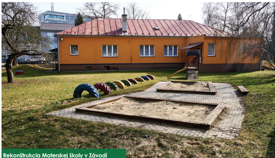
Rekonštrukcia Materskej školy v Závodí

Jedným z ďalších investičných projektov mesta je rekonštrukcia Materskej školy Juraja Závodského 16 v Žiline. Cena diela, ktorého predpokladaná doba výstavby je 15 mesiacov, predstavuje vyše 350 000 eur s DPH. V súčasnosti to je čiastočne podpivničený jednopodlažný objekt, pričom projekt rieši nadstavbu jedného podlažia nad celým pôdorysom budovy školy. Areál je oplotený, slúži ako dvor a detské ihrisko pre deti predškolského veku. Po zrealizovaní bude budova dvojpodlažná so strechou tvaru valby. V priestoroch nadstavenej časti školy budú vytvorené dve nové triedy pre deti a potrebné zázemie na prevádzku materskej školy, čím sa vytvoria miesta pre ďalších 33 detí predškolského veku. Detské ihrisko bude doplnené o pieskovisko a pribudne nové vybavenie ihriska – preliezky, hojdačky a domčeky.