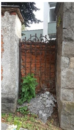
Obr. 2: Torzo historickej vstupnej brány.