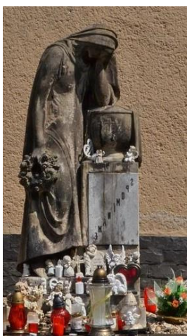
Obr. 3: Socha – Plačúca matka nad urnou.