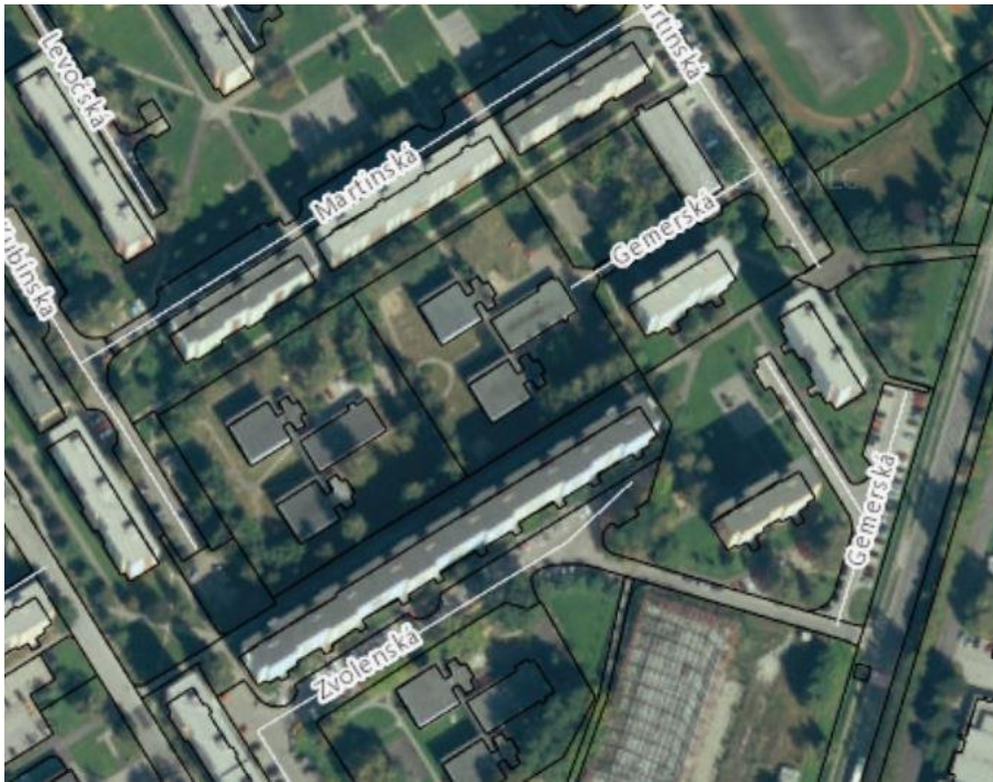
Obr. 3: Vnútroblok Zvolenská/Martinská.