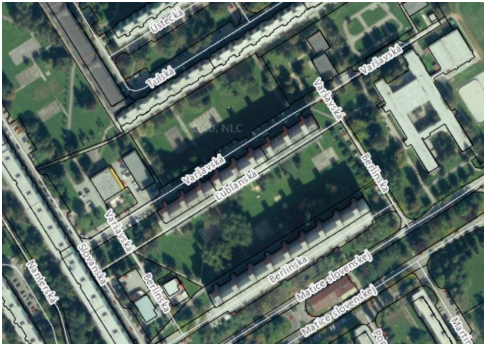
Obr. 1: Vnútrobloky Tulsá/Varšavská, Lublanská/Berlínska.