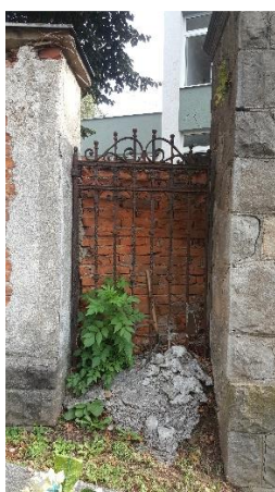
Obr. 2: Torzo historickej vstupnej brány.