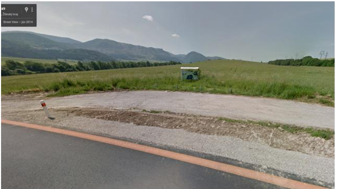
Bojisko – letecký pohľad Bojisko – pohľad predný